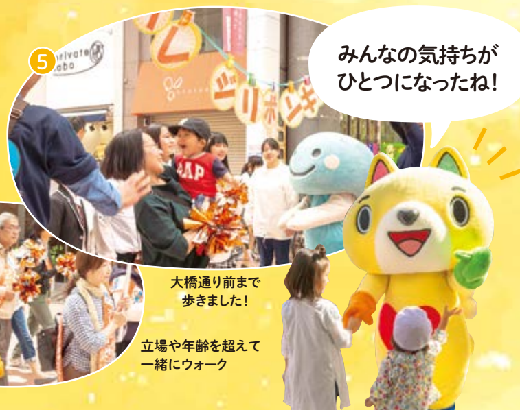
みんなの気持ちが ひとつになったね!