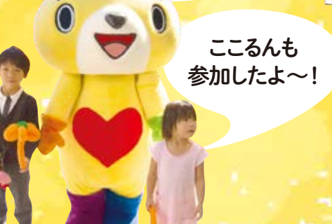
こころんも 参加したよ～!