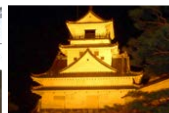
高知城のライトアップ