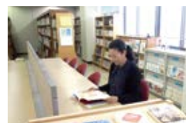
5F じんけんライブラリー