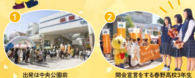
出発は中央公園前