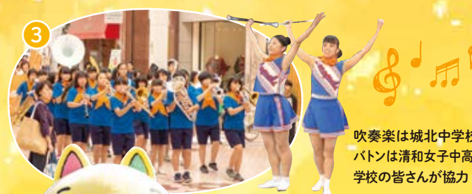
吹奏楽は城北中学校、 バトンは清和女子中等 学校の皆さんが協力